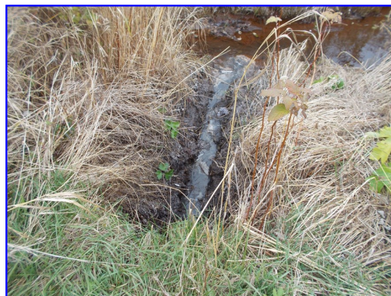
Exemple de rejet dans l'environnement observé en Minganie

Les eaux usées domestiques sont celles généralement évacuées à la salle de bain et à la cuisine. On y retrouve des matières fécales et des produits chimiques qui peuvent migrer dans les eaux de surface ou souterraines jusqu'à potentiellement contaminer l'environnement et les sources d'approvisionnement en eau de consommation. Le traitement inapproprié des eaux usées peut donc menacer la santé humaine et même dans certains cas entraîner la mort. La Loi sur la qualité de l'environnement interdit leur rejet dans l'environnement sans traitement préalable. En absence d'un service municipalisé, c'est l'installation septique conforme qui permet le traitement adéquat des eaux usées.