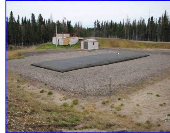
Station de traitement des boues située à Longue-Pointe-de-Mingan

Il est possible d'obtenir une vidange supplémentaire moyennant des frais additionnels et celle-ci doit être demandée au service des matières résiduelles de la MRC de Minganie. Si votre installation septique n'a jamais été vidangée, adressez-vous à ce service afin de vous y inscrire. Pour les institutions, commerces et industries, la vidange est sur demande et celle-ci doit aussi être adressée à la MRC de Minganie.